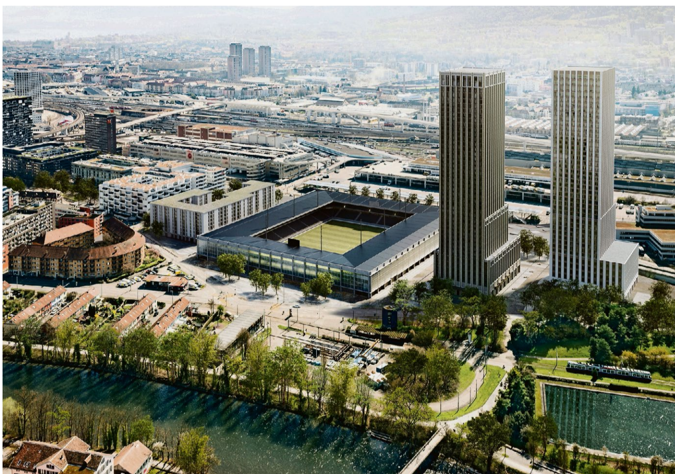
Genossenschaftswohnungen, Stadion, Hochhäuser: So soll es auf dem Hardturmareal künftig aussehen.

Die gesamten Investitionen betragen 570 Millionen Franken. Diese teilen sich die Allgemeine Baugenossenschaft Zürich (ABZ), die Stadion Züri AG sowie die beiden Immobilienfonds Siat Immobilien AG und Interswiss Immobilien AG sowie die Credit Suisse Anlagestiftung. Damit die privaten Investoren auf dem städtischen Land bauen dürfen, gewährt ihnen die Stadt Zürich vier Baurechtsverträge mit einer Laufzeit von 92 Jahren: einen für das Baufeld mit den Genossenschaftswohnungen (A), einen für das Stadion (B) und je einen für die Hochhäuser (C1 und C2). Dafür